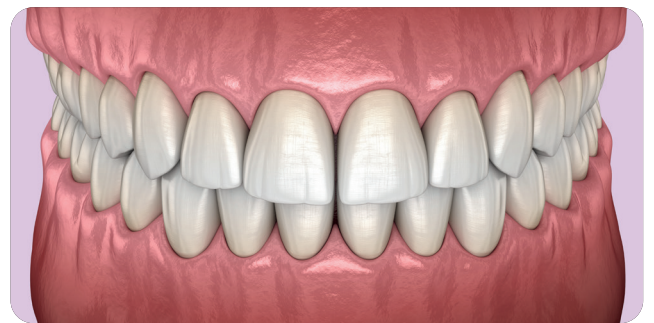
Dents soignées suite au détartrage.